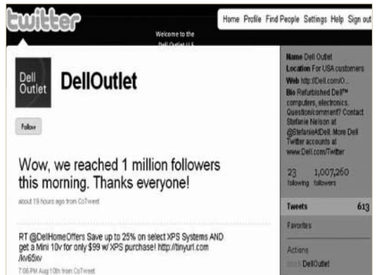
DellOutlet의 트위터 계정

소셜미디어에서 유통되는 정보는 빠르게 유포된다. 기업이 소셜미디어의 빠른 속도에 대응하려면 조직 내 각 부문이 전에 없는 긴밀함으로 유기적으로 움직여야 한다. 또한 고객과의 직접 커뮤니케이션을 통해 획득한 정보들이 내부 프로세스를 변화시키고 실제 제품 개발이나 서비스 개선으로 이어질 수 있도록 조직 내 체계를 갖추어야 한다. 따라서 소셜미디어를 홍보의 일환이 아닌 기업 경영의 전체적 흐름에서 바라보아야 하며, 기업 커뮤니케이션 전체를 총괄하여 하나의 목소리를 낼 수 있도록